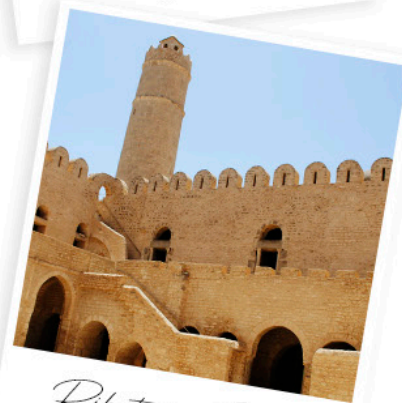
Ribat in Sousse