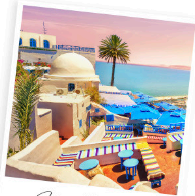
Sidi Bou Said