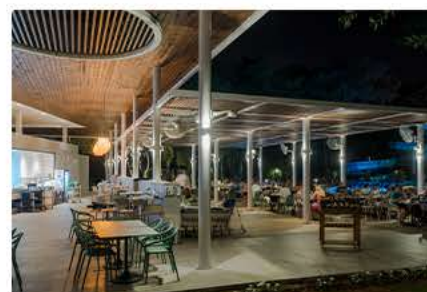
Дальневосточный А'ля Карт Ресторан