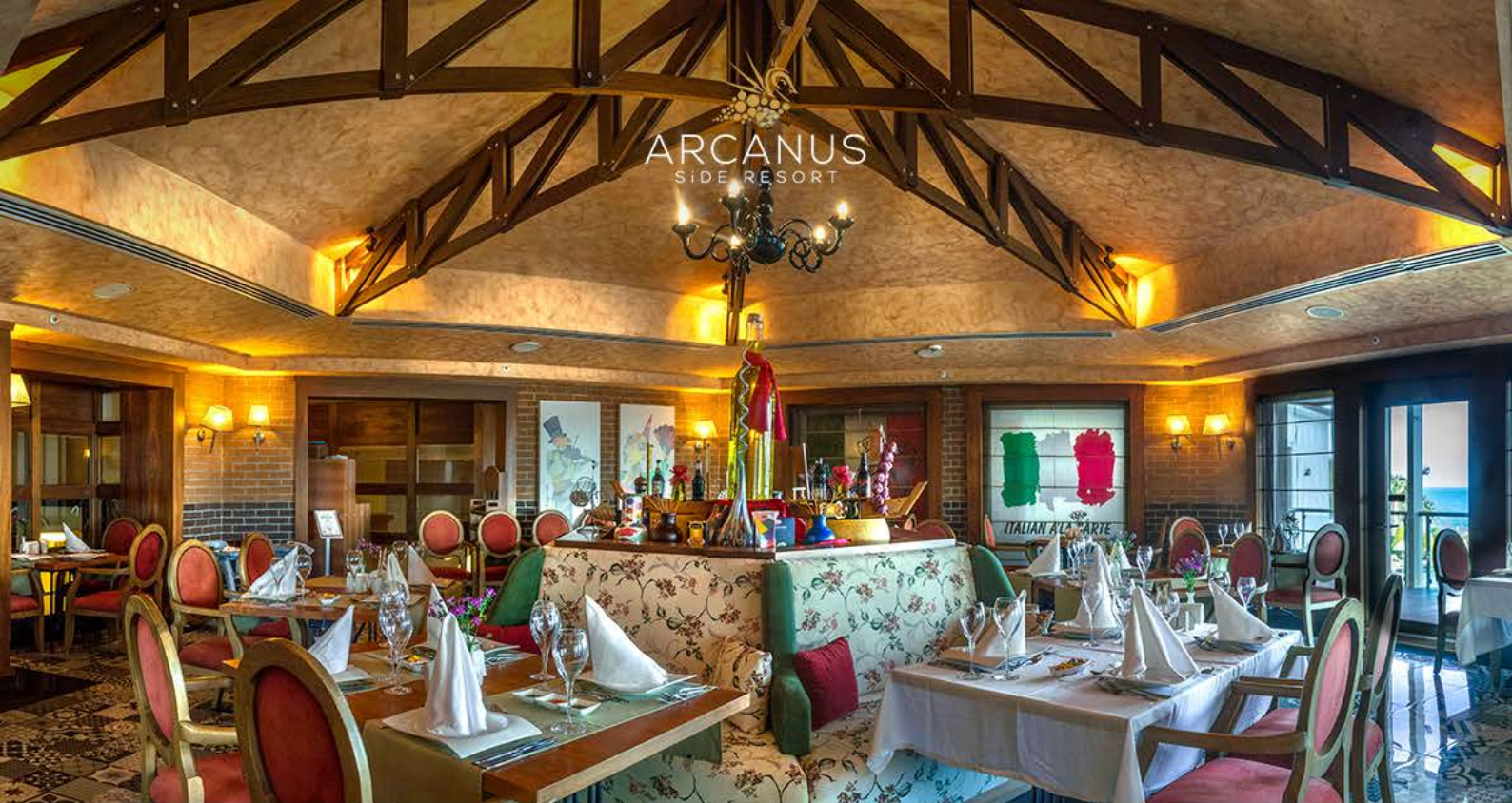
Итальянский А'ля Карт Ресторан