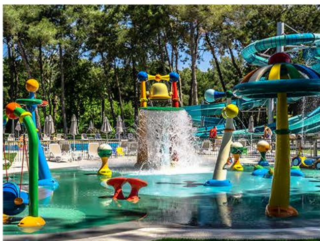
Аквапарк Splash Zone