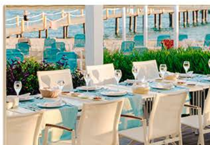
Турецкий А'ля Карт Ресторан