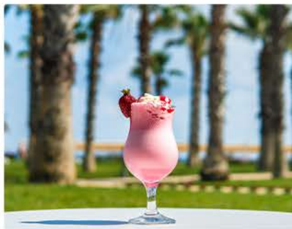
Passion Коктейльный Бар