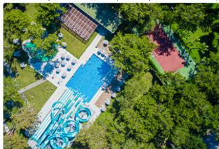
Бассейн с горками

Бассейны могут быть временно закрыты по причинам плохих погодных условий ли по соображениям гигиены и безопасности.