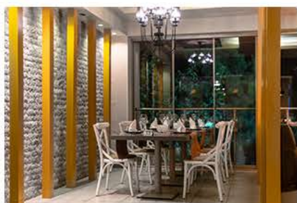
Мексиканский А'ля Карт Ресторан

* В зависимости от погодных условий, запросов гостей или по техническим причинам в часы и дни работы баров и ресторанов могут быть внесены изменения