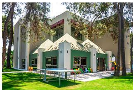
Сад Детского клуба

TV, Playstation, детский туалет; аквапарк с 7 водными горками и открытой детской площадкой. Мини-клуб находится рядом с рестораном Aqua Snack.