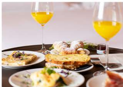
Сервис в номер