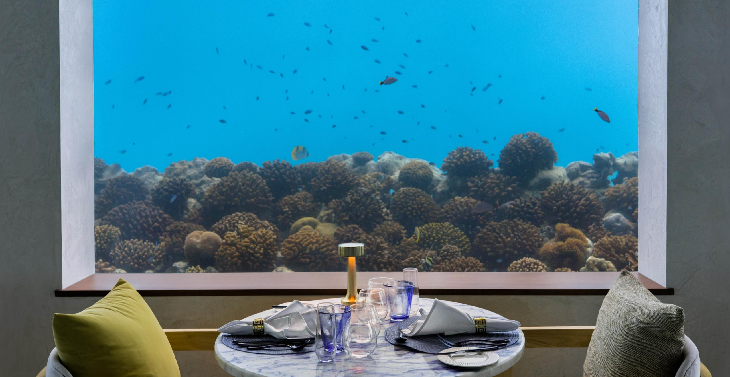
Only BLU Under Ocean Restaurant - Interior