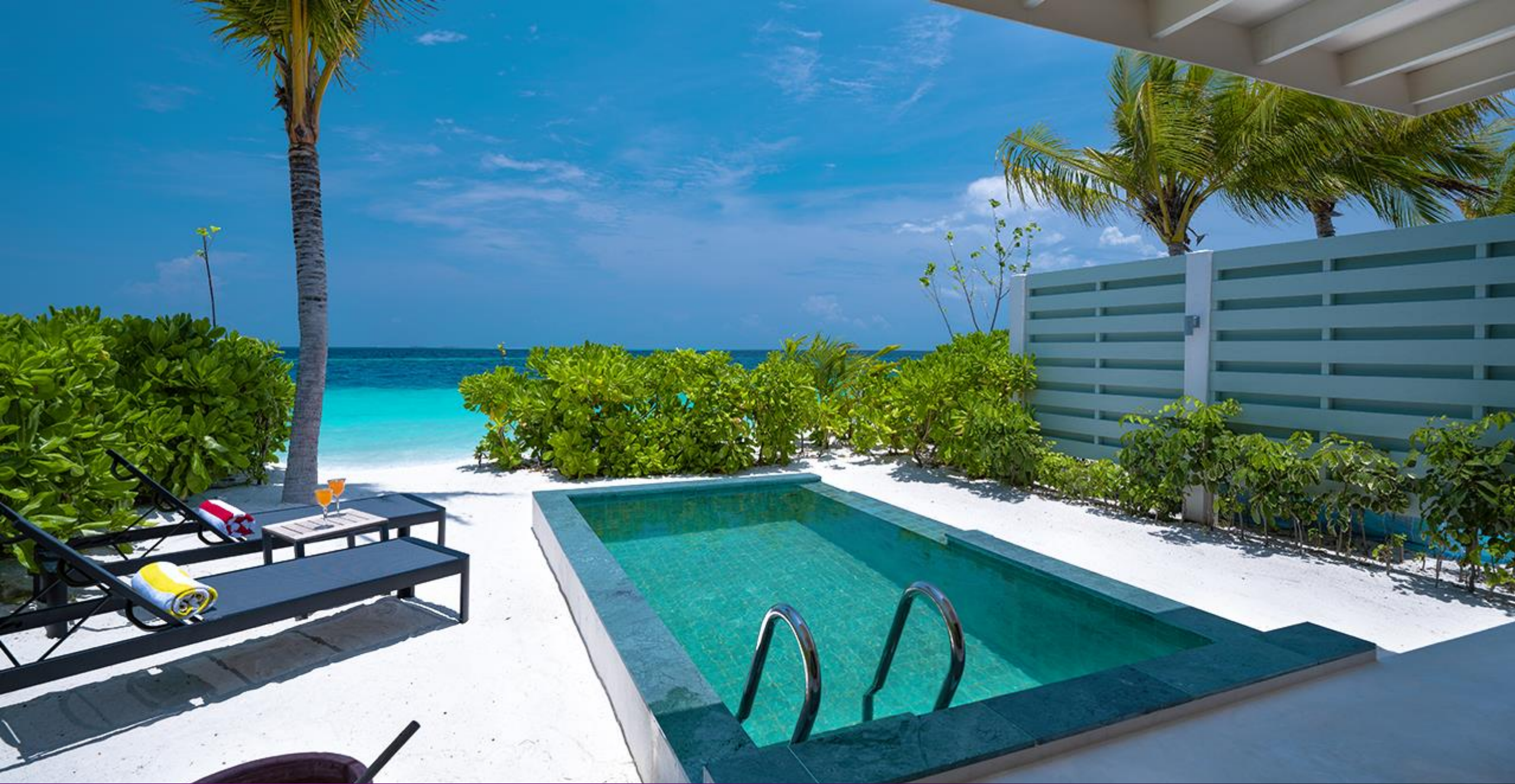
SunNest Beach Pool Villa – Pool & Beach View