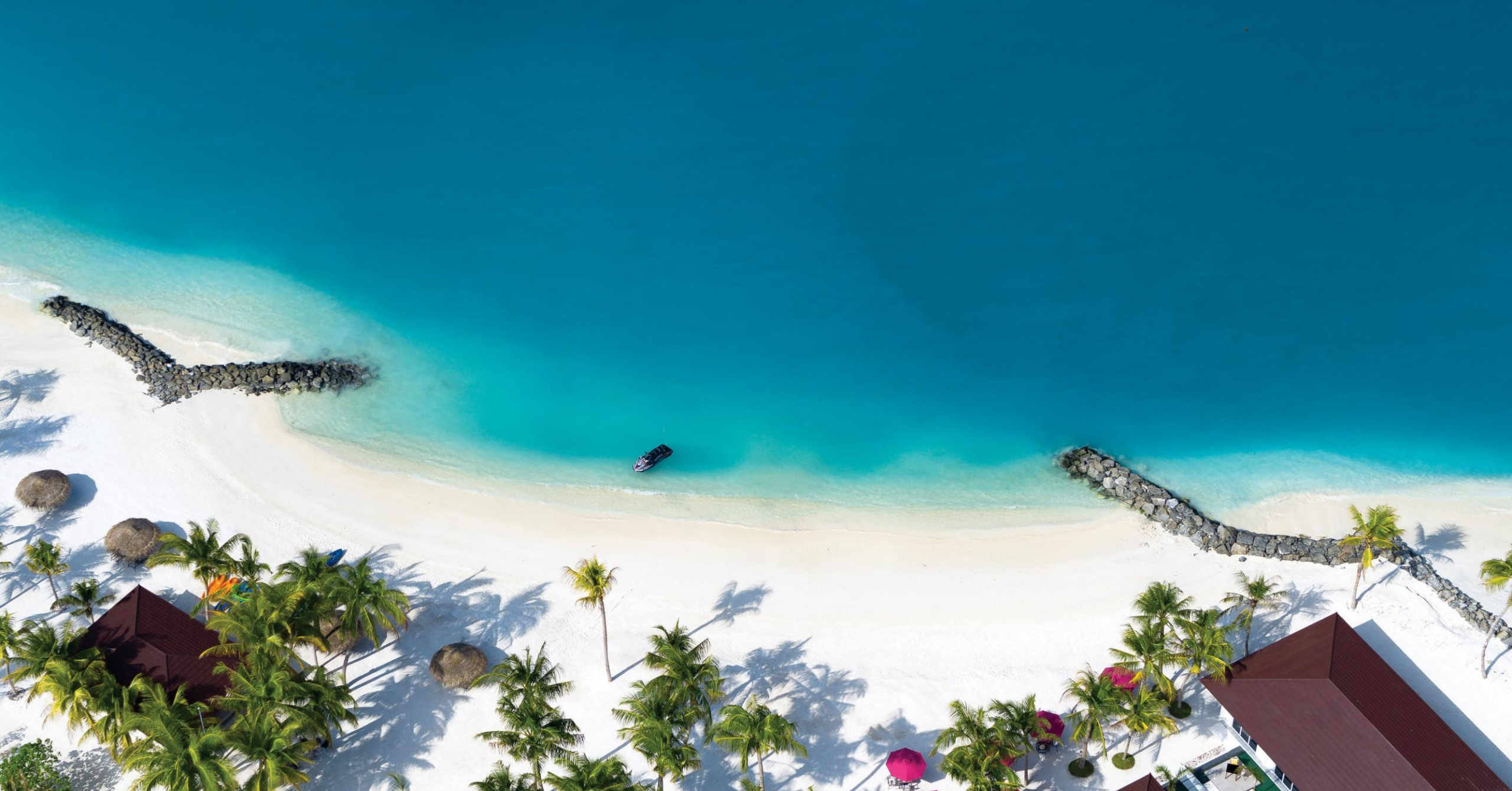
SunNest Beach Villas – Eastern Beach Aerial View