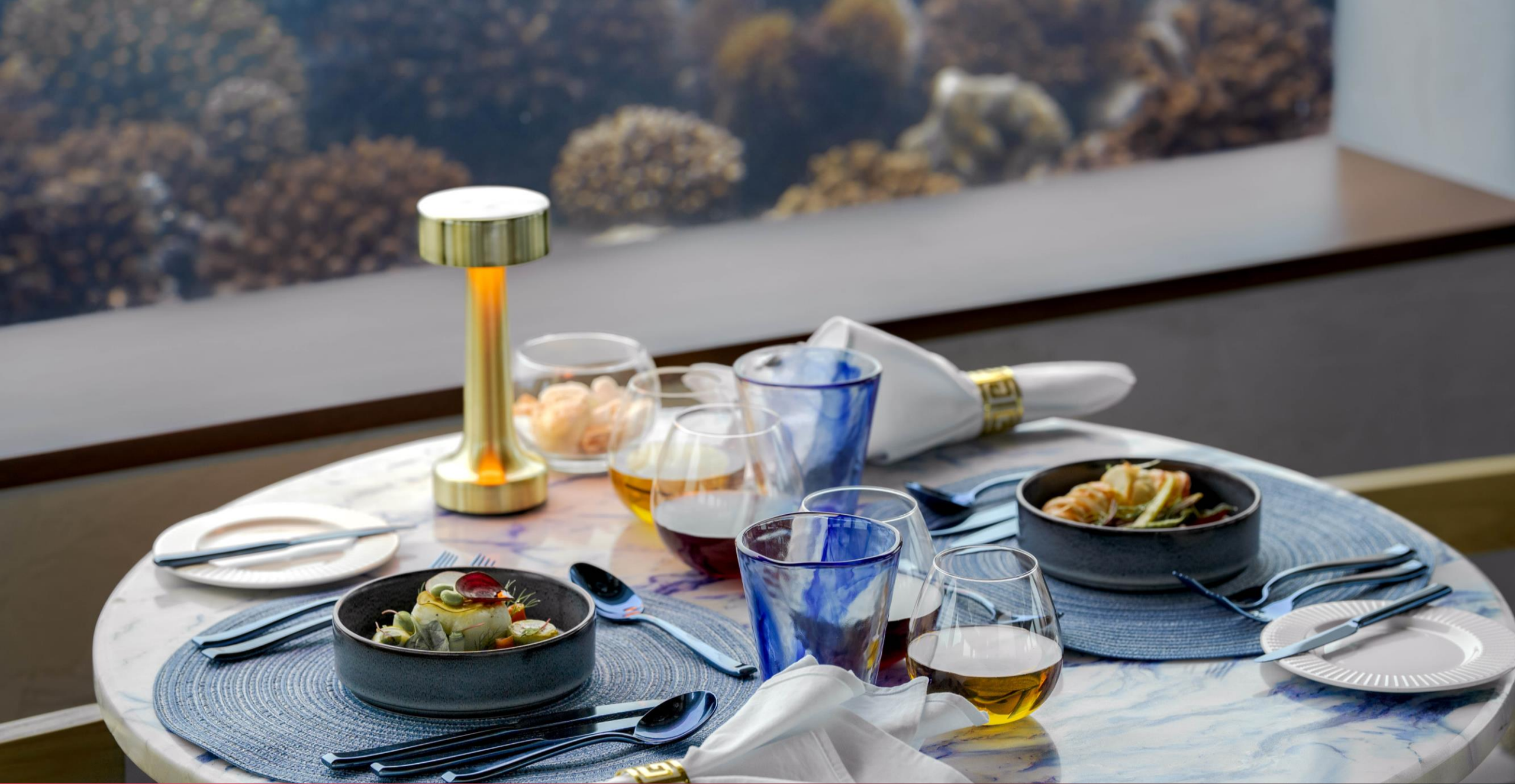
Only BLU Under Ocean Restaurant – Table Set Up