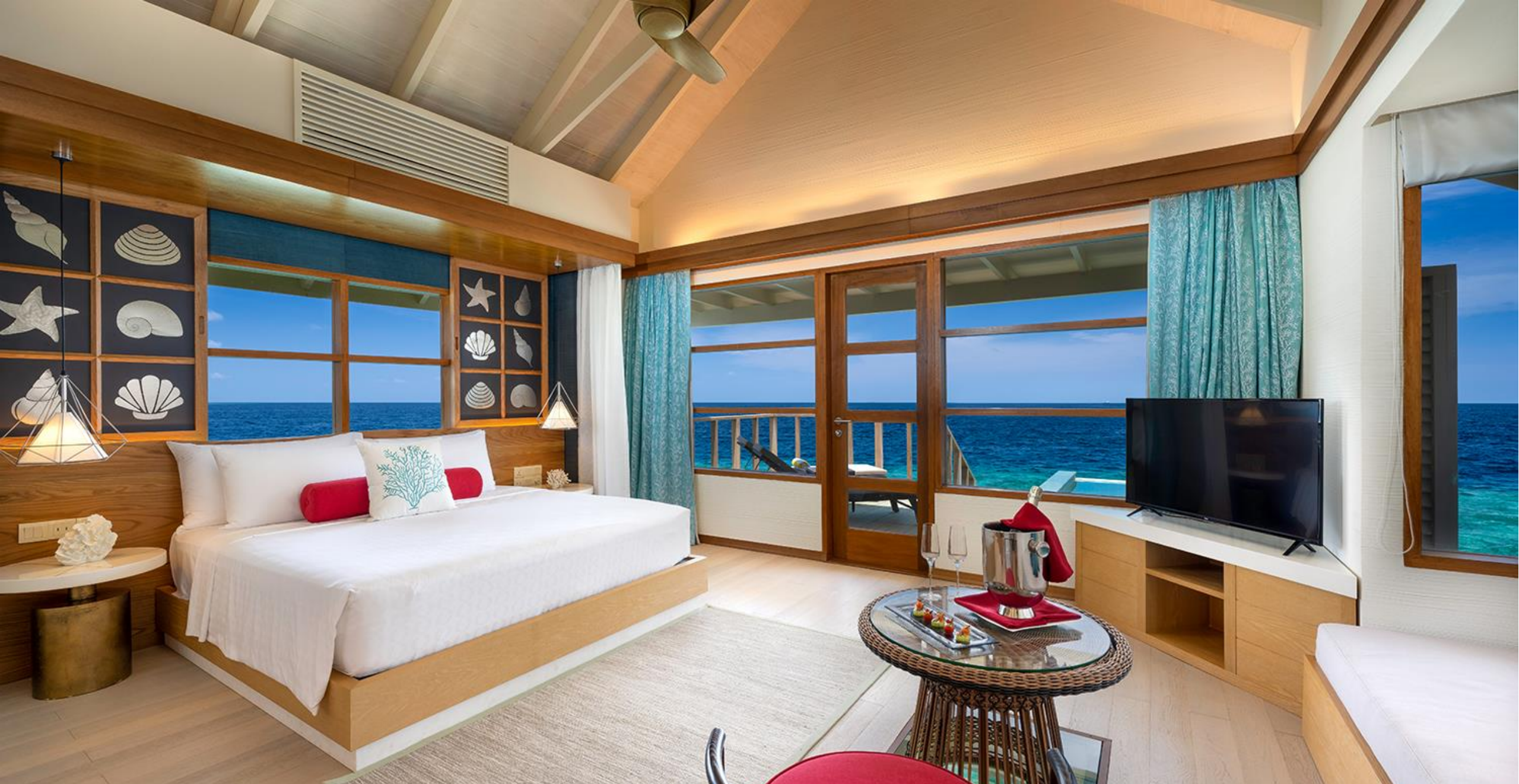
SunNest Water Villa & Nest Water Villa – Bedroom Interior with Sea View