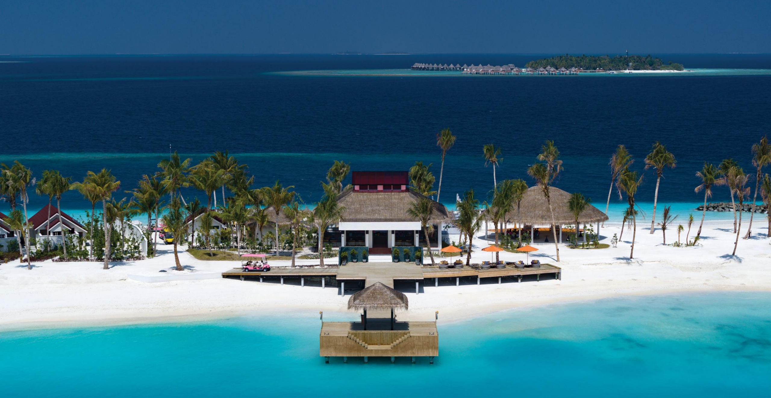
Island and Arrival Jetty