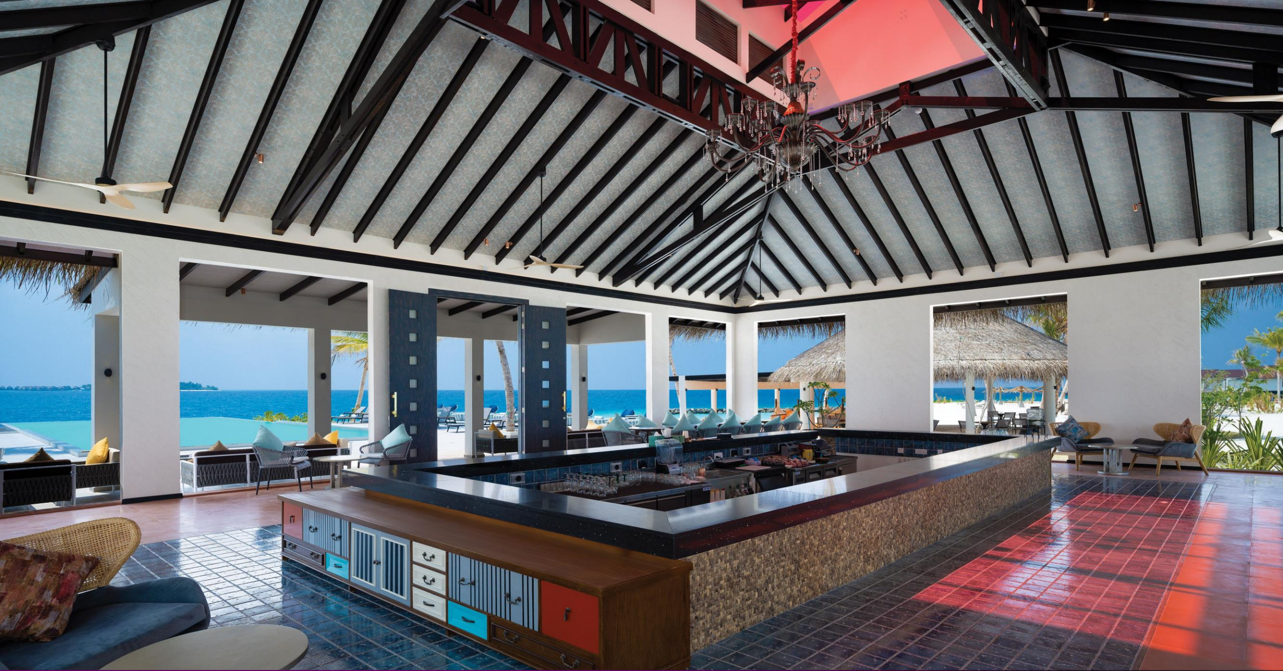
Swing Bar - Interior