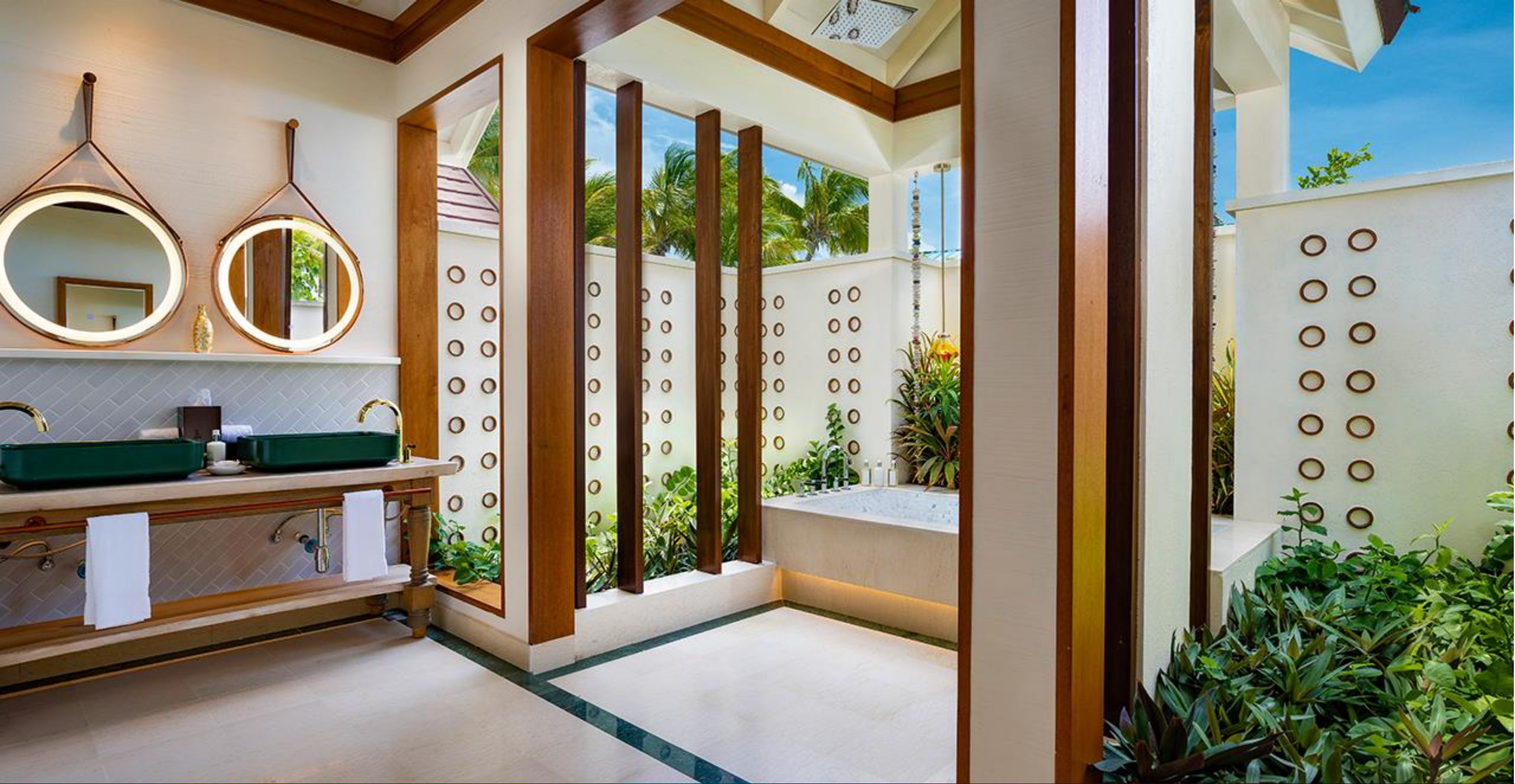
SunNest Beach Pool Villa – Bathroom