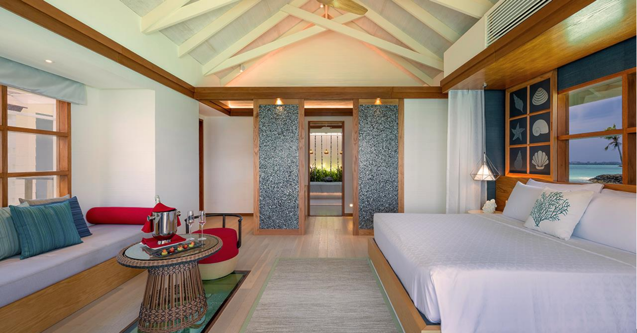
SunNest Water Villa & Nest Water Villa – Interior view