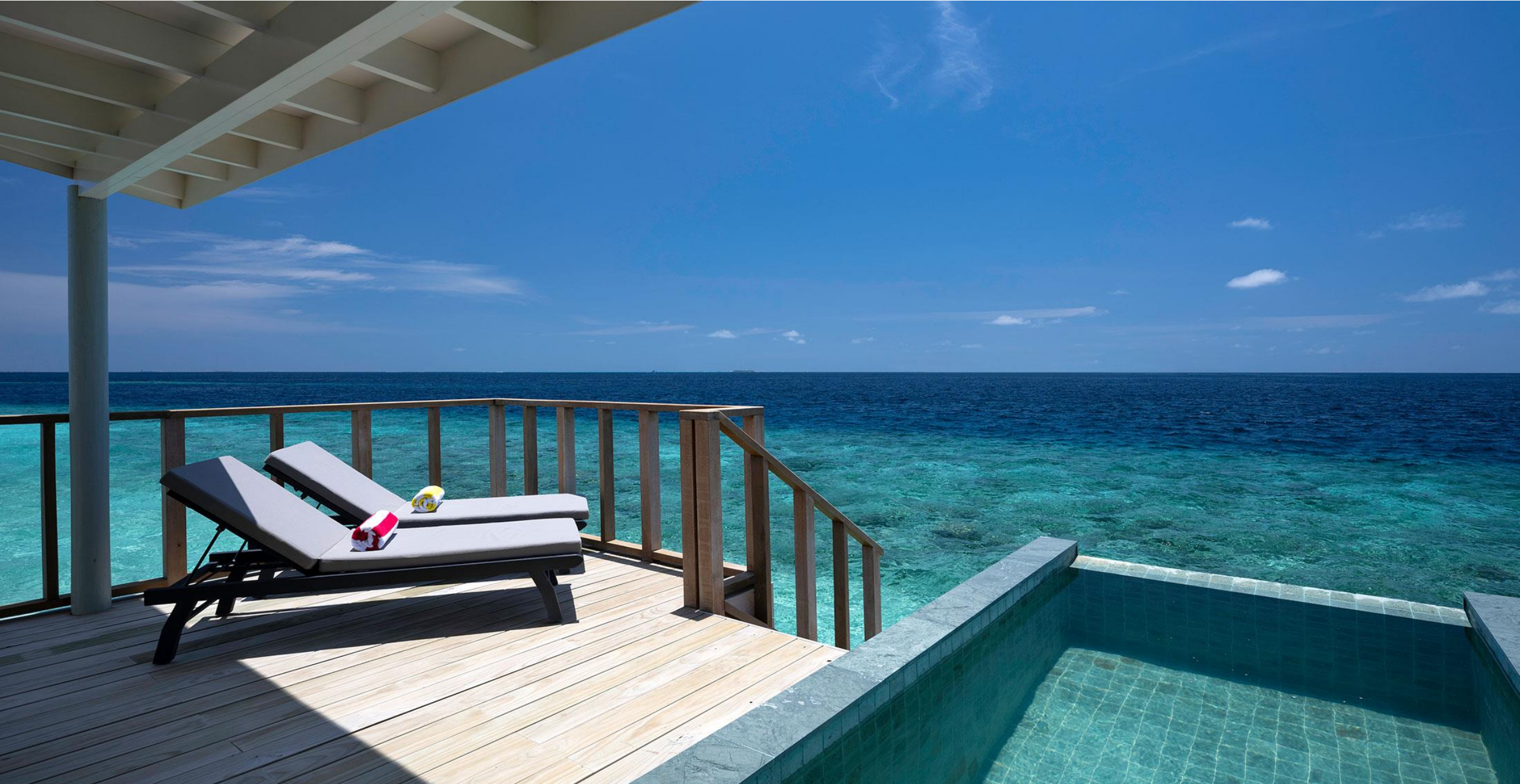
SunNest Water Villa & Nest Water Villa with Pool – Deck View