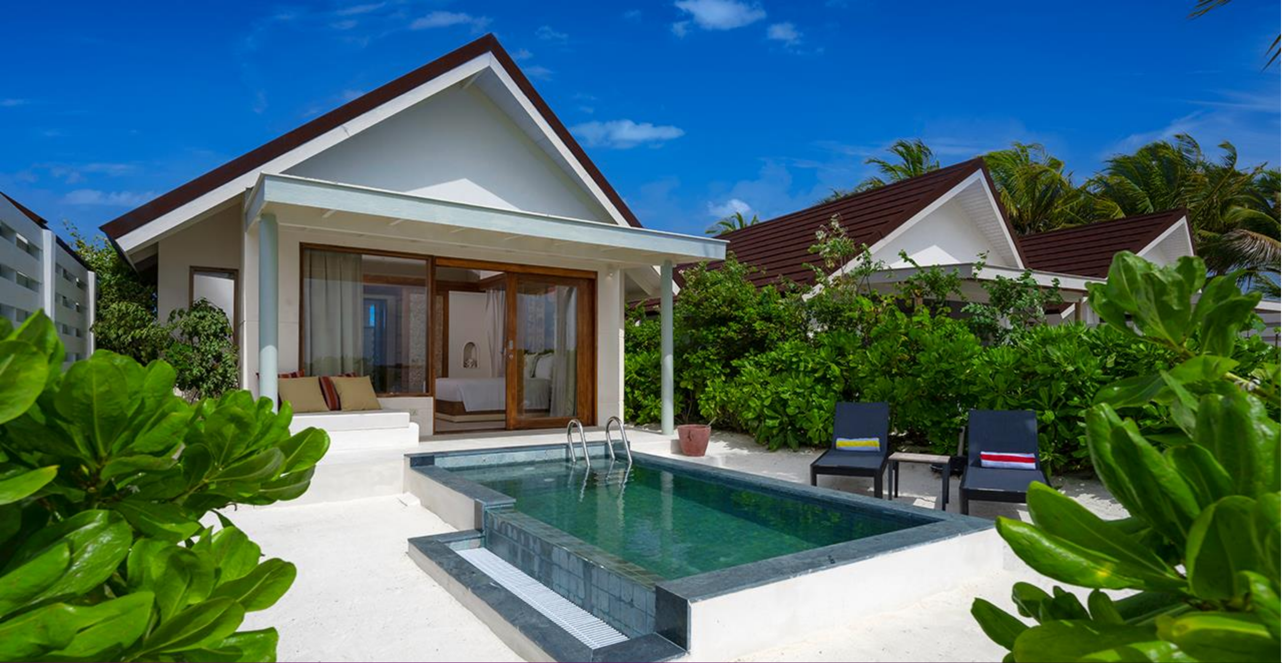
SunNest Beach Pool Villa