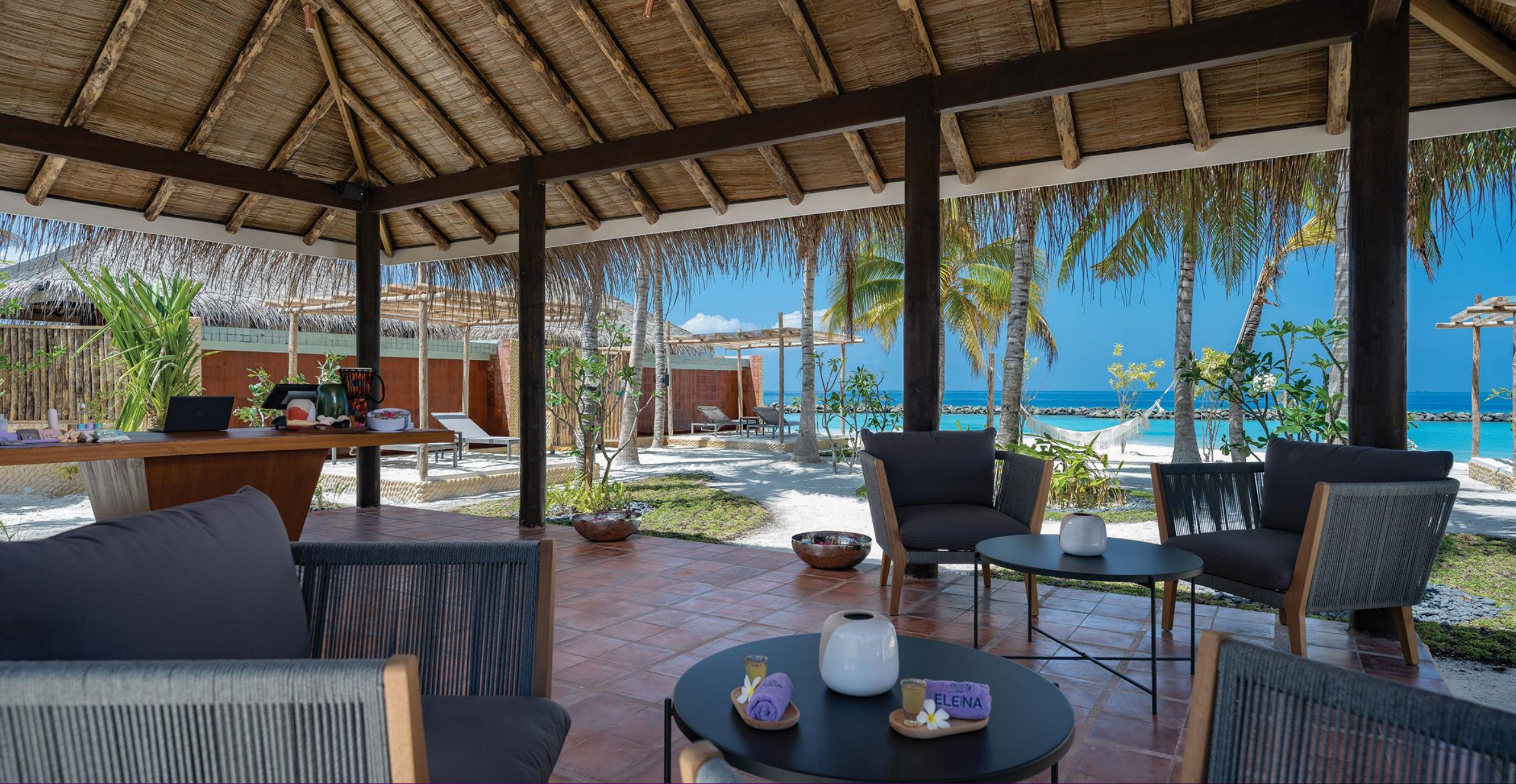
ELENA Spa – Entrance