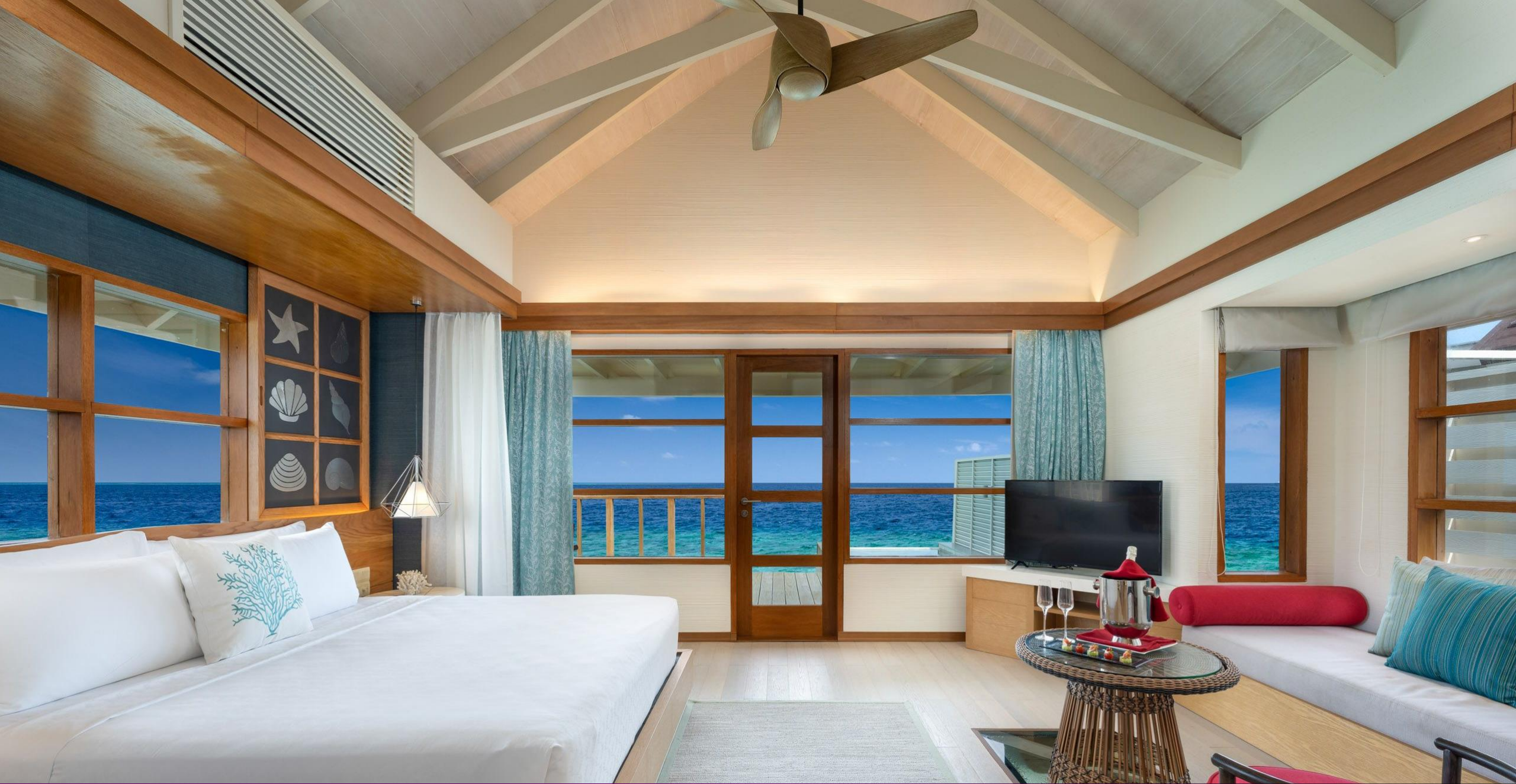
SunNest Water Villa & Nest Water Villa – Bedroom & Ocean view