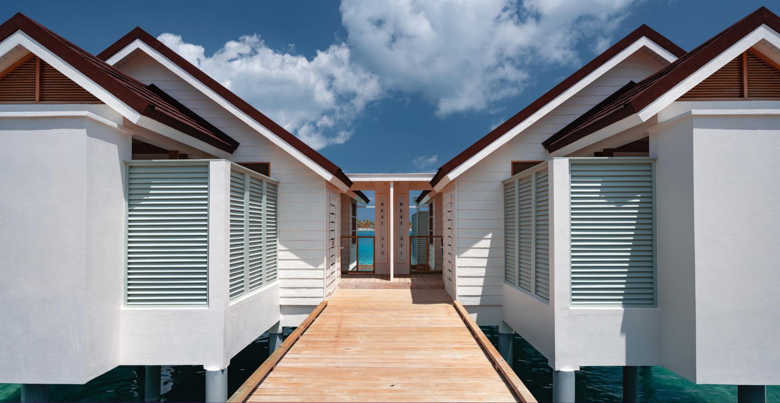
Water Villa – Entrance