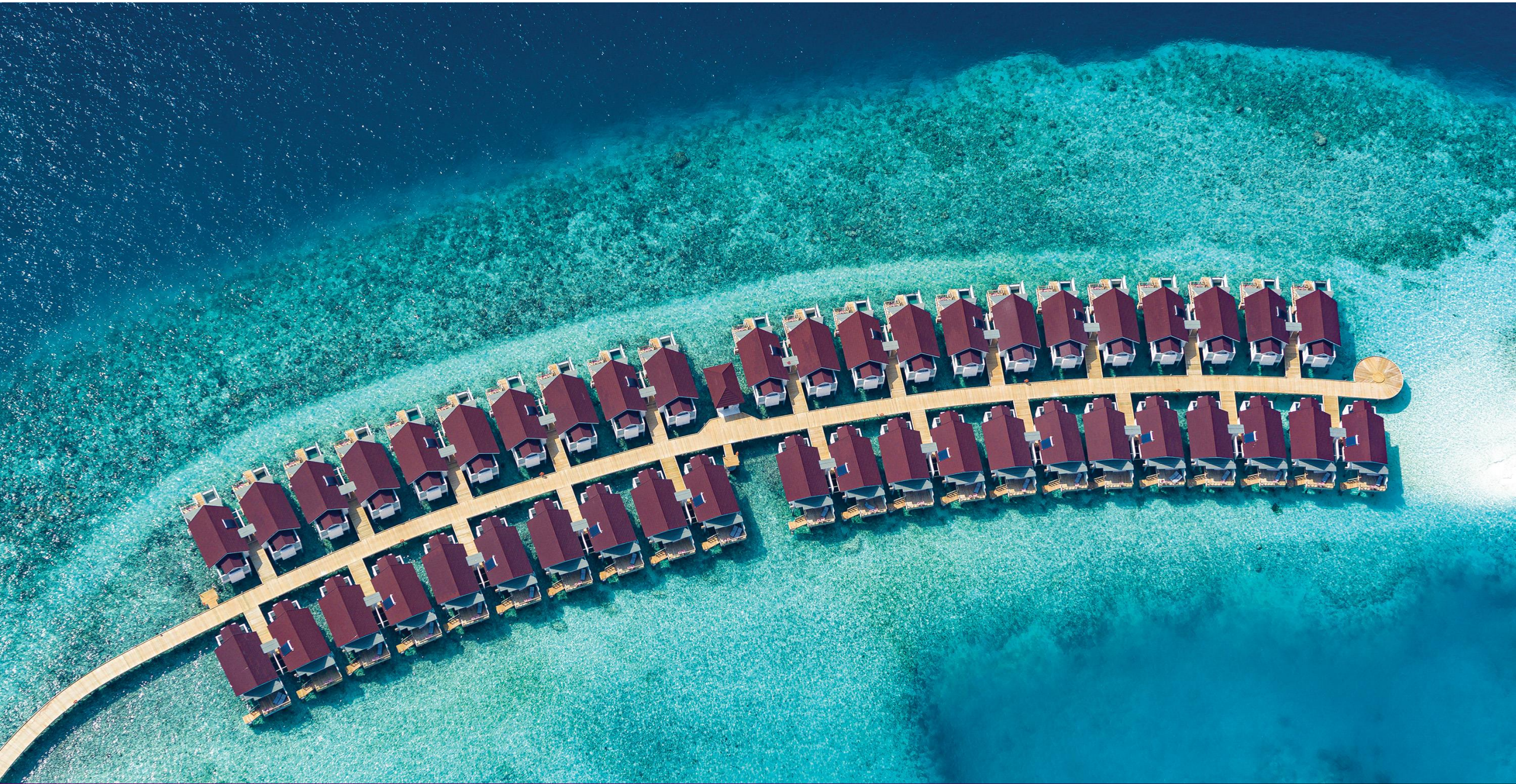
Water Villa – Aerial View