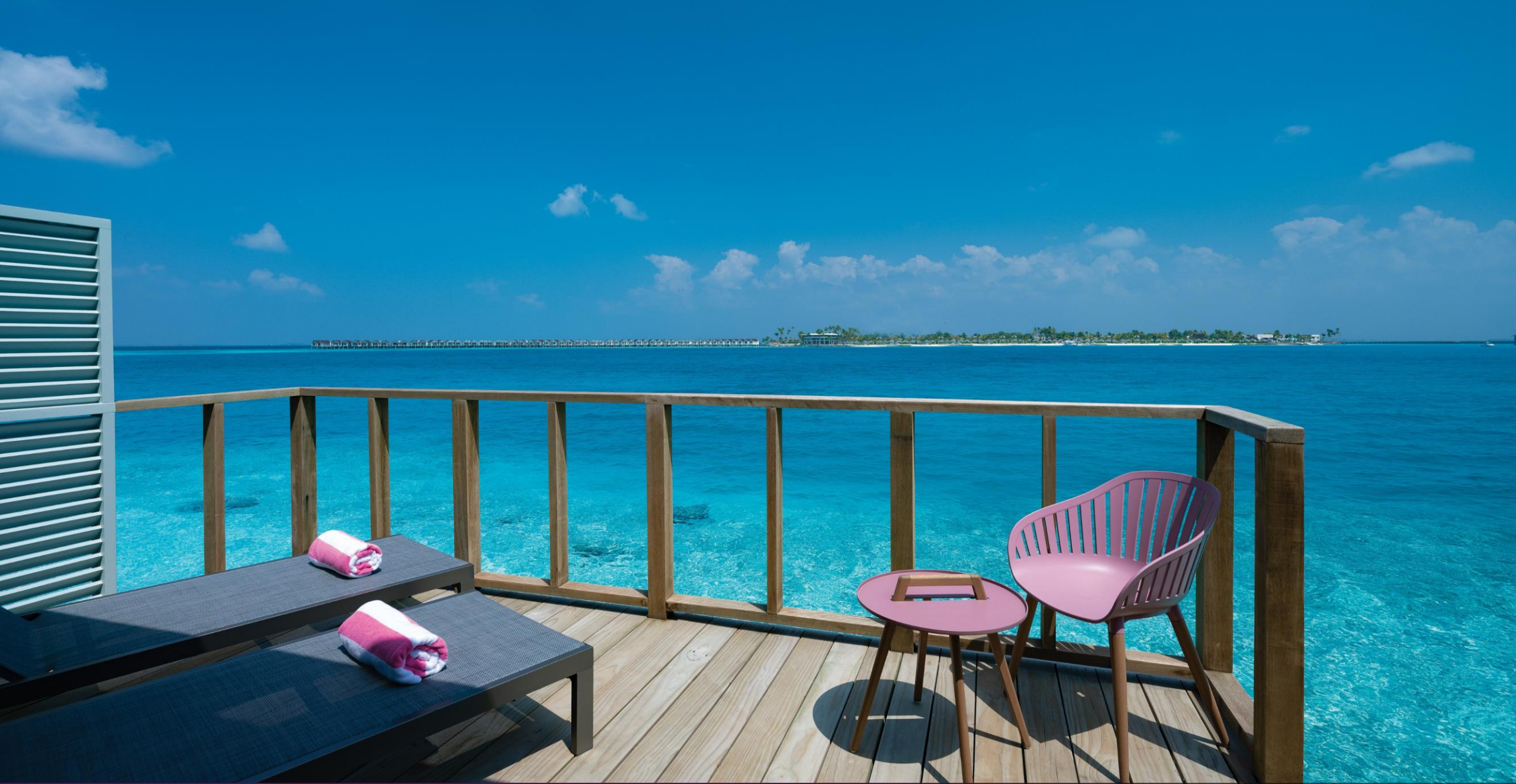
SunNest Water Villa without Pool – Deck View