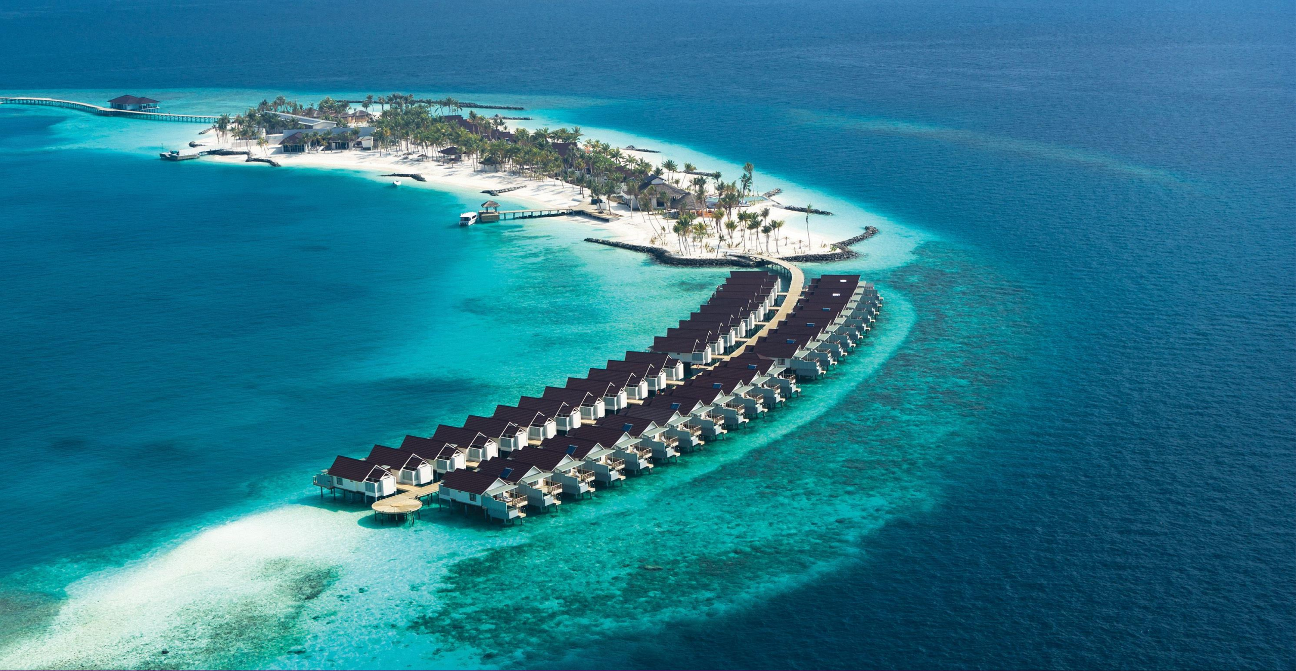
Full Island Aerial View