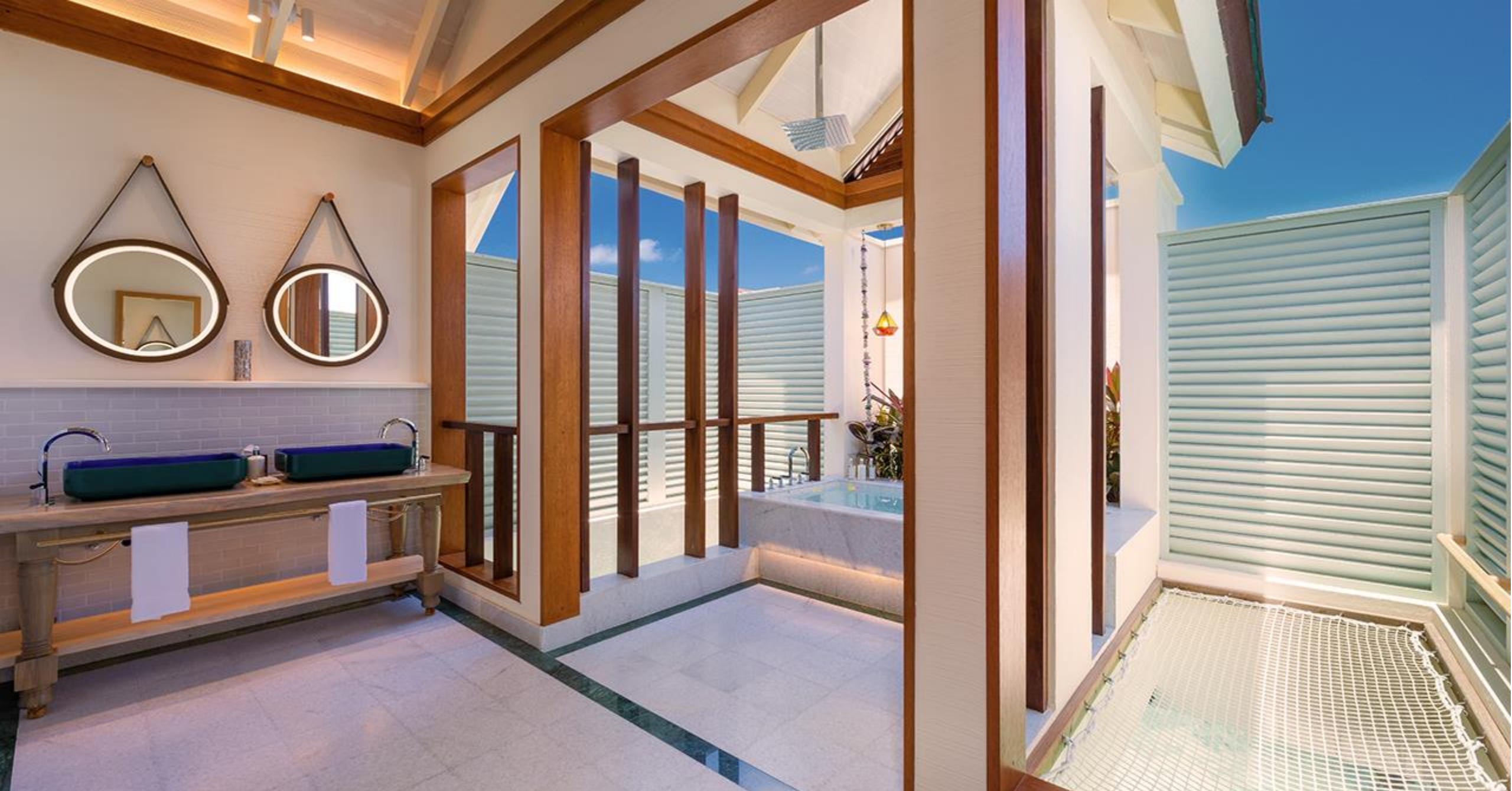
SunNest Water Villa & Nest Water Villa - Bathroom