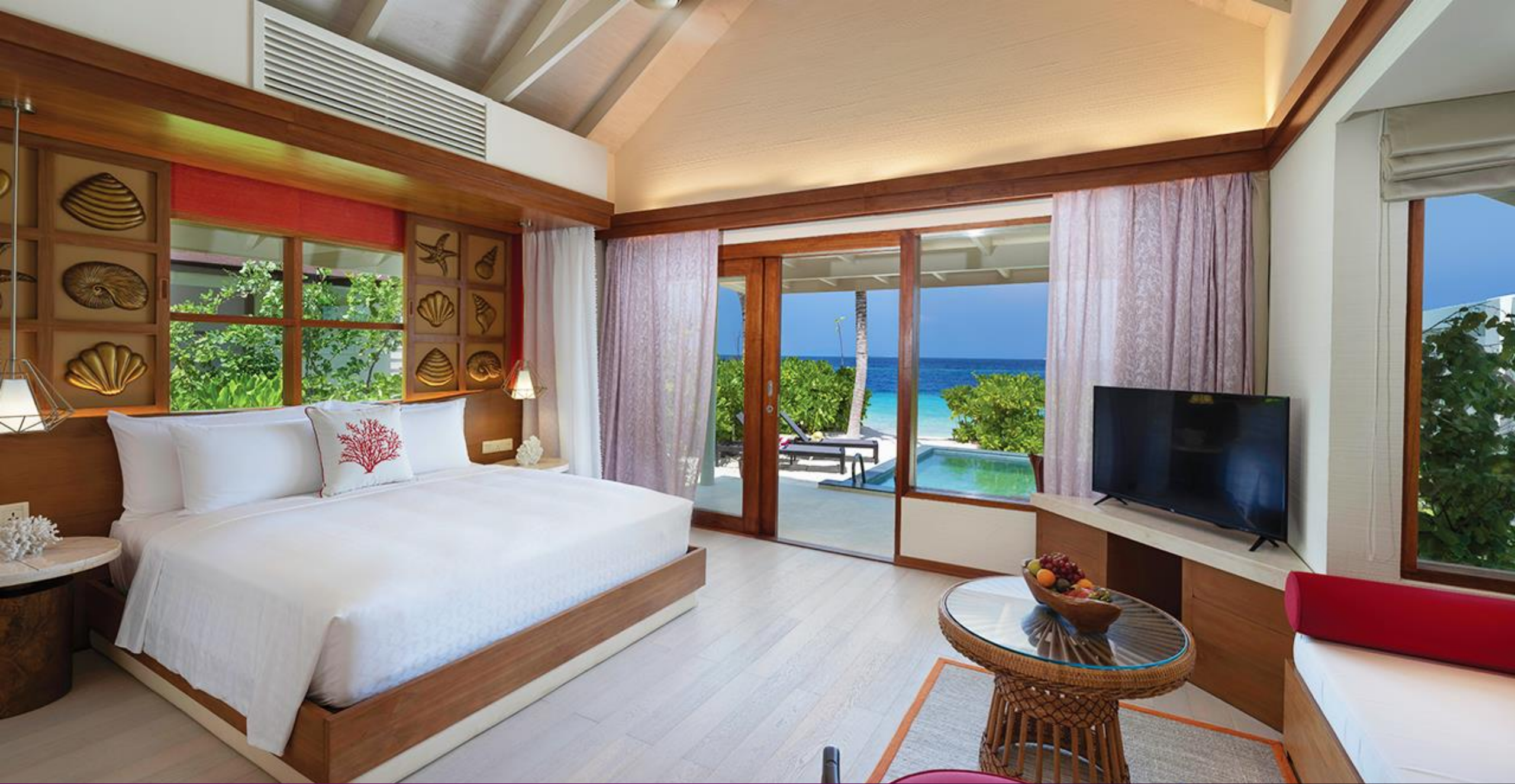
SunNest Beach Pool Villa - Bedroom