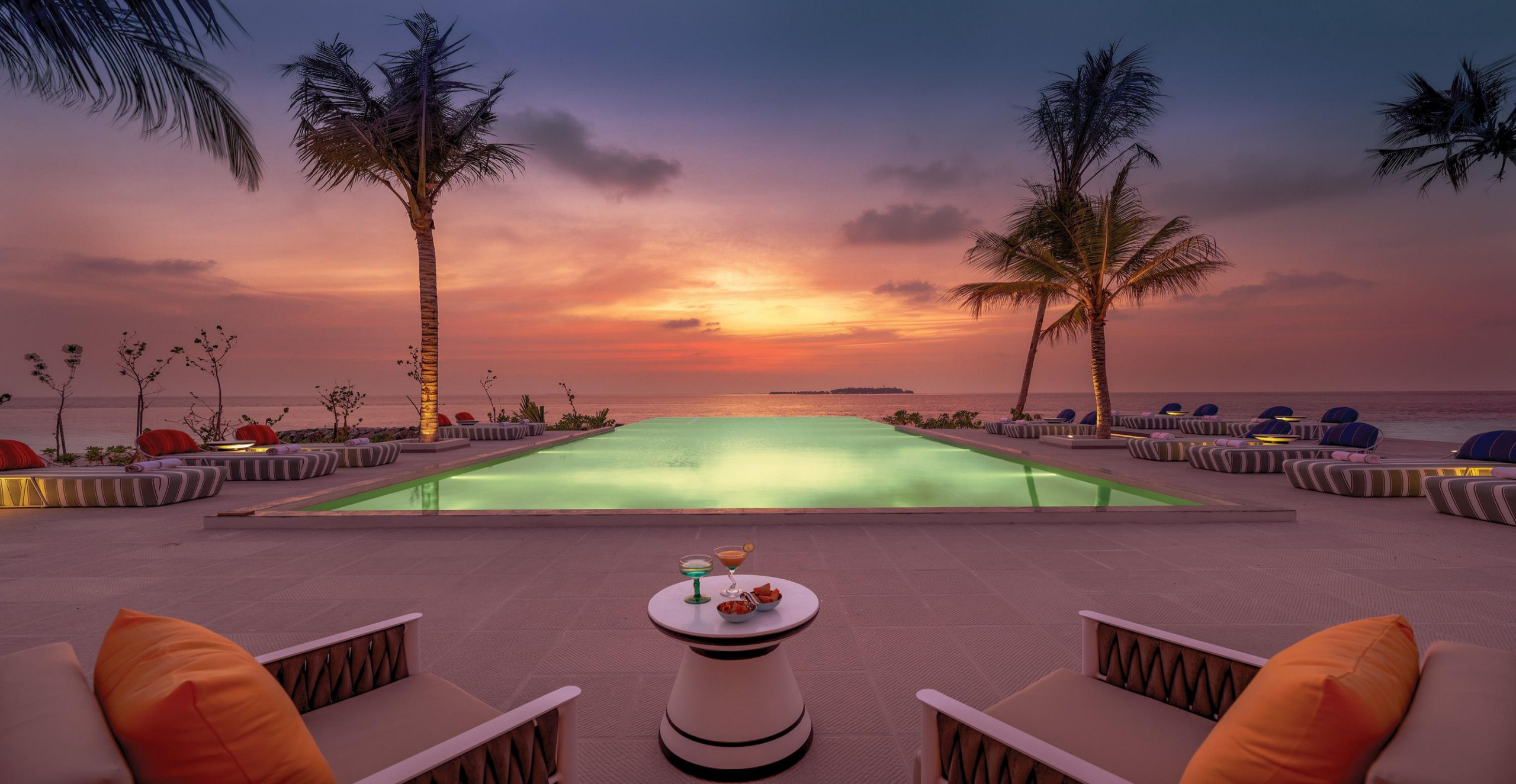
Swing Bar - At Sunset