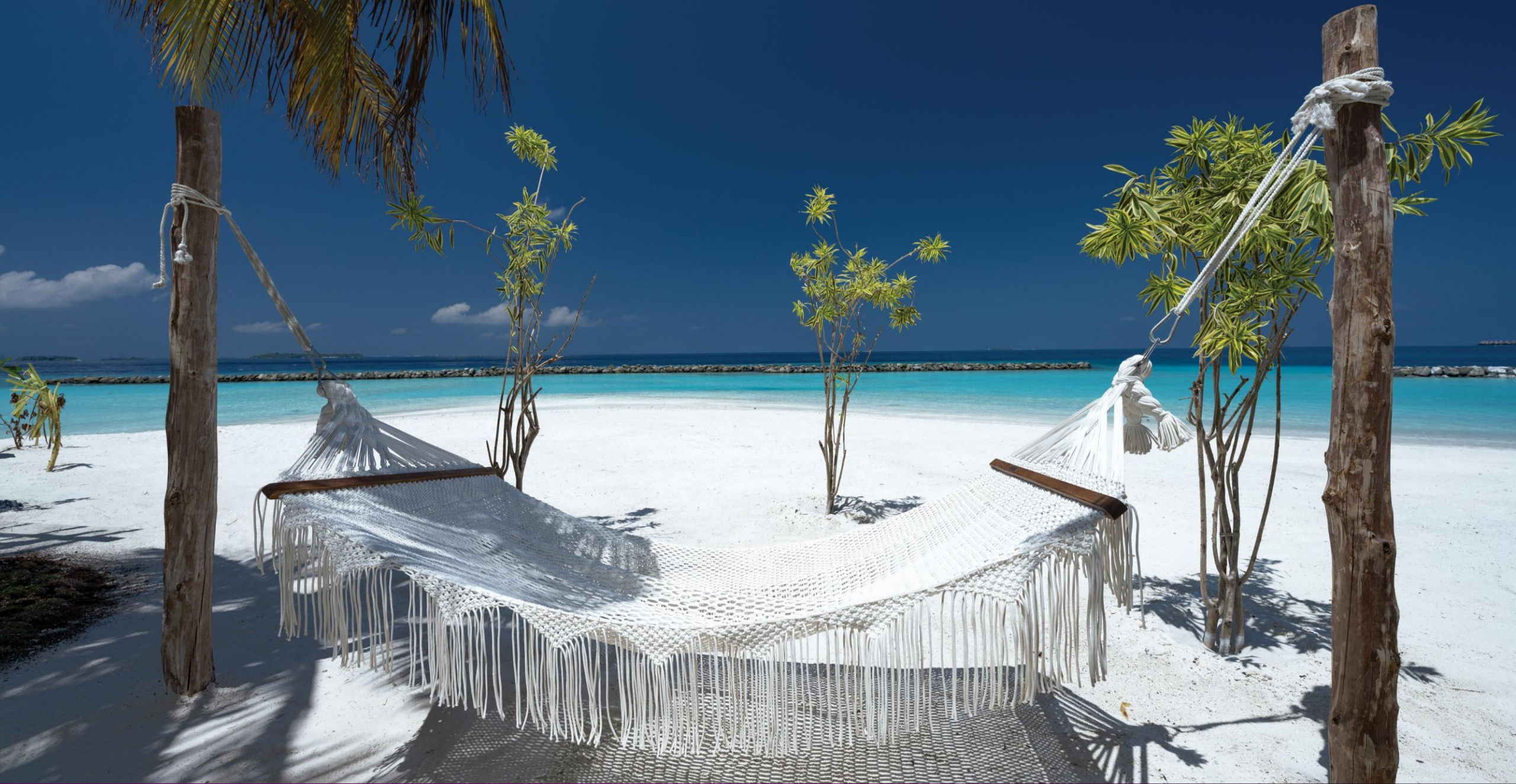
ELENA Spa – Beach Hammock