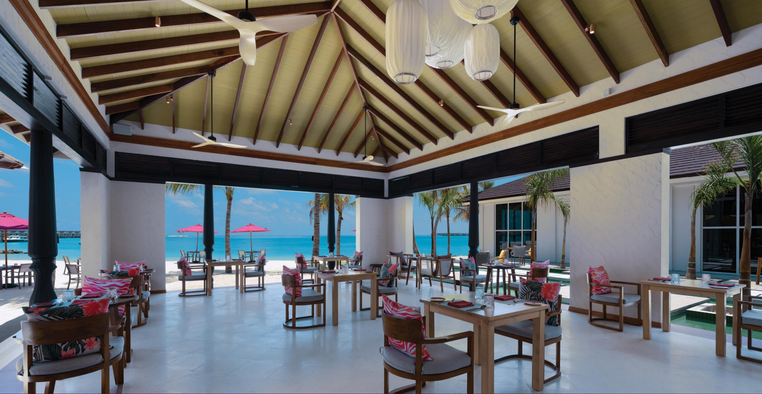
Ylang Ylang – At Lunch