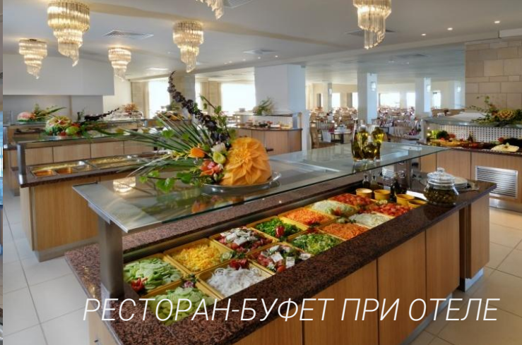
РЕСТОРАН-БУФЕТ ПРИ ОТЕЛЕ