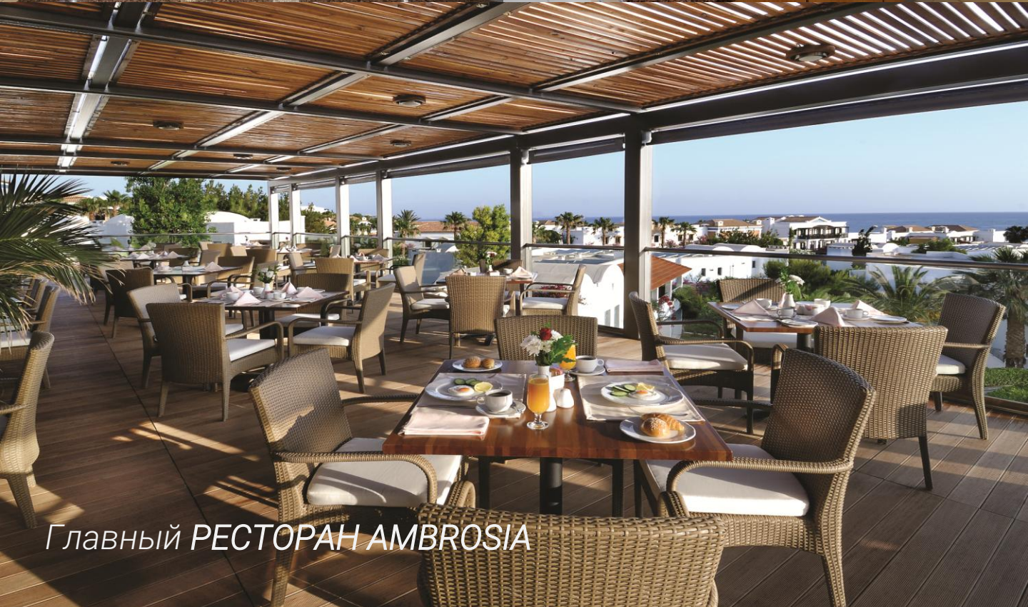
Главный РЕСТОРАН AMBROSIA