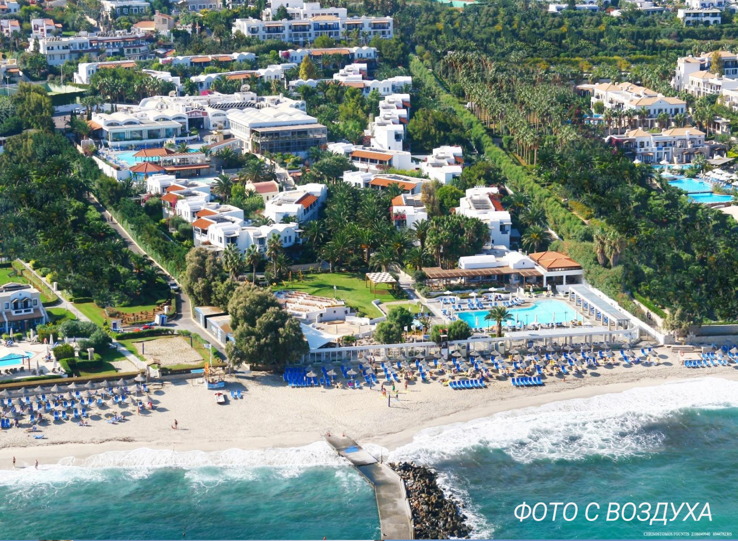
ФОТО С ВОЗДУХА