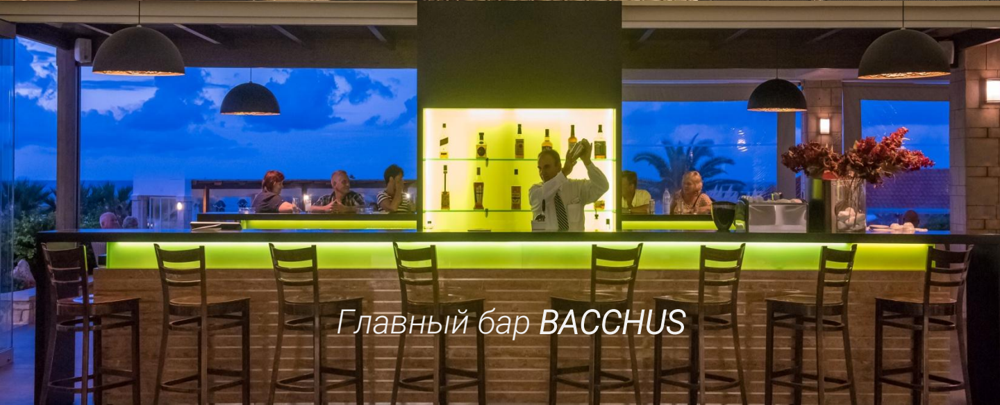
Главный бар VACCHUS