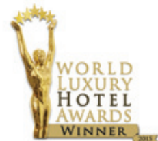
Luxury Coastal Hotel Global Winner 2015