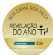
Best New Restaurant 2014