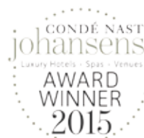
Reader's Award 2015