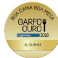
Best Restaurant 2016