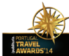
Best Resort 2014