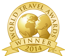
Portugal's Leading Hotel Residences 2014