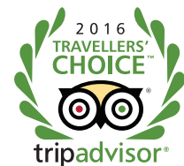
TOP 25 Luxury Hotels Portugal 2016