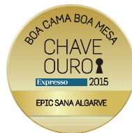
Golden Key 2015