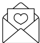
ПОЗДРАВЛЕНИЕ ПИСЬМО LETTER