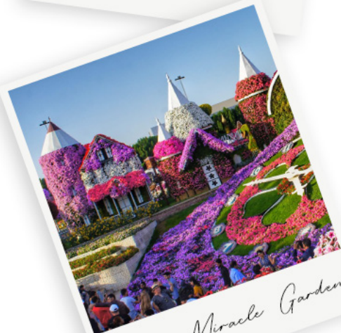
Dubai Miracle Garden