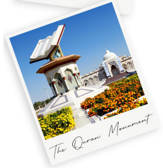
The Quran Monument