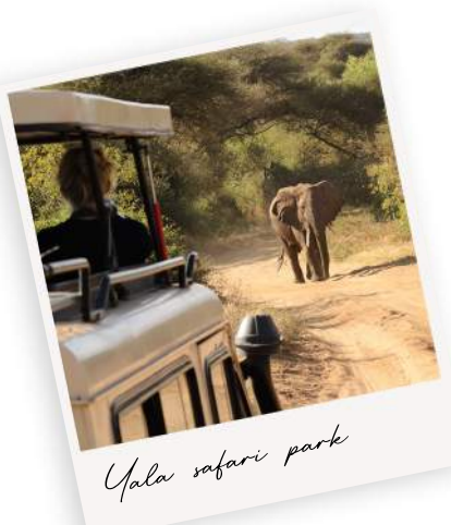
Yala safari park