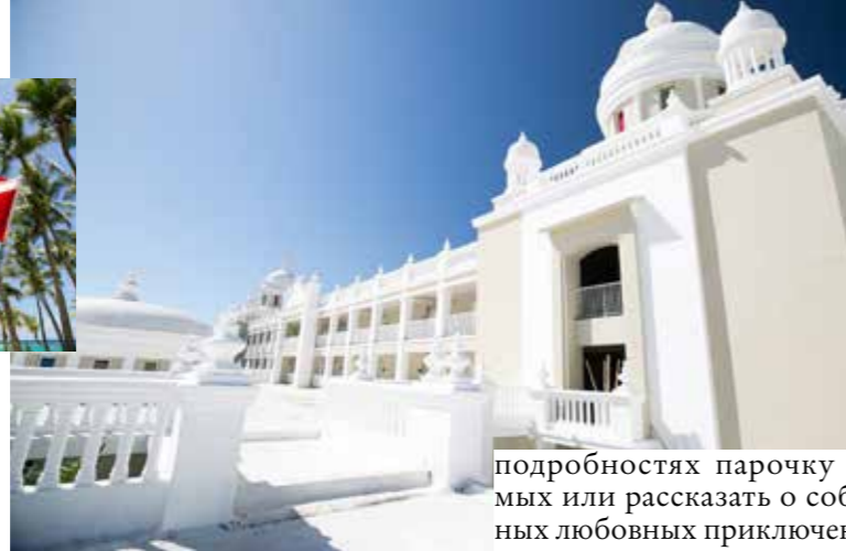
Riu Palace Bavaro

СЕМЕЙНЫЕ ОТЕЛИ У МНОГИХ ОТЕЛЕЙ В ПУНТА- КАНЕ БОЛЬШАЯ ТЕРРИТОРИЯ. НО В RIU PALACE BAVARO ОТ ЛЮБОГО КОРПУСА ДО ПЛЯЖА ВСЕГО ПЯТЬ МИНУТ ХОДЬБЫ. В ОТЕЛЕ ЖЕ LUXURY VANIA PRINCIPE AMBAR GREEN ПО ТЕРРИТОРИИ КУРСИРУЕТ СВОЙ ВНУТРЕННИЙ ТРАНСПОРТ — КЛУБНЫЕ БАГГИ, У КОТОРЫХ ЕСТЬ И МАРШРУТЫ, И РАСПИСАНИЕ.