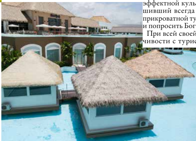
Hard Rock Hotel & Casino

При всей своей шальной влюбчивости с туристками местные