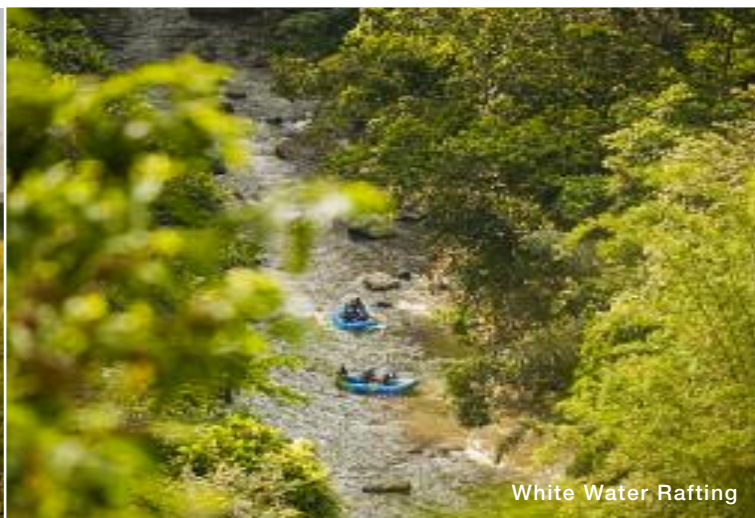
White Water Rafting