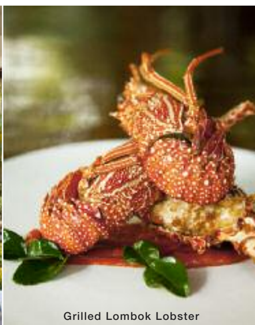
Grilled Lombok Lobster