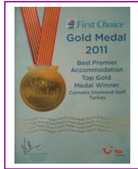
FIRST CHOICE - GOLD MEDAL