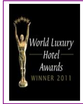
WORLD LUXURY - BEST LUXURY GOLF RESORT