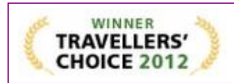
TRIPADVISOR - Top 25 All Inclusive Resorts in Europe