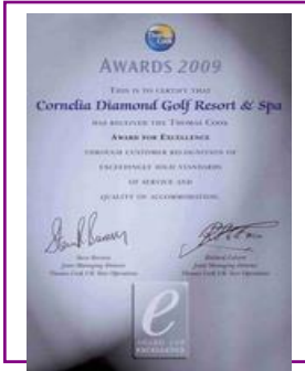
AWARD for EXCELLENCE