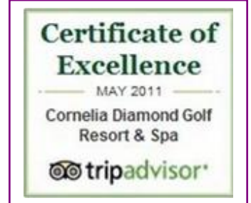
TRIP ADVISOR - CERTIFICATE of EXCELLENCE