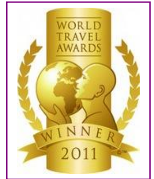
WTA - Europe's Leading Resort Villa