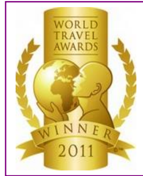
WTA - World's Leading Fully Integrated Resort