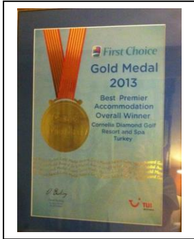
TUI UK – GOLD MEDAL OVERALL WINNER