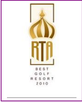
RUSSIAN TRAVEL AWARDS