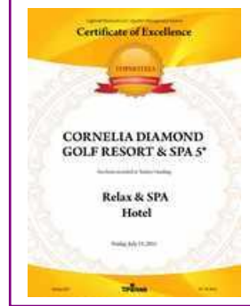
TOPHOTELS – Turkey's Leading Relax & SPA