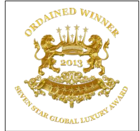
SEVEN STAR LUXURY AWARDS