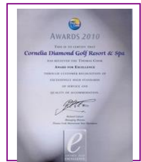
MARK for EXCELLENCE