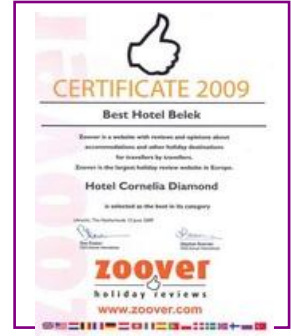
ZOOVER – BEST HOTEL BELEK