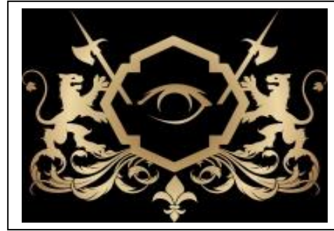
EUROPEAN BEST SPORT HOTEL 2012