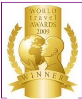
WTA – Europe's Leading Golf Resort