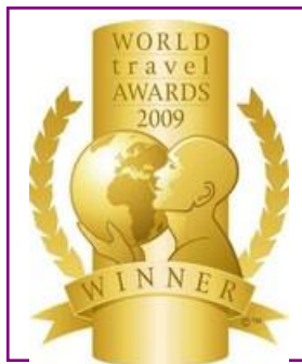
WTA – Turkey's Leading Spa Resort