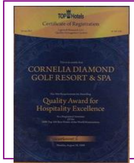
TOPHOTELS – AWARD for EXCELLENCE