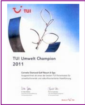
TUI - UMWELT CHAMPION