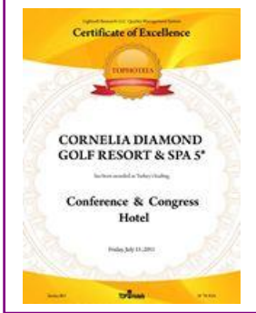
TOPHOTELS – Turkey's Leading Conference