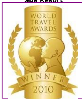
WTA – Europe's Leading Spa Resort