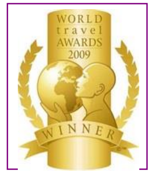
WTA – Europe's Leading Spa Resort