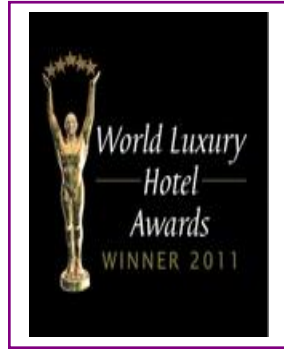
WORLD LUXURY - BEST LUXURY SPA RESORT