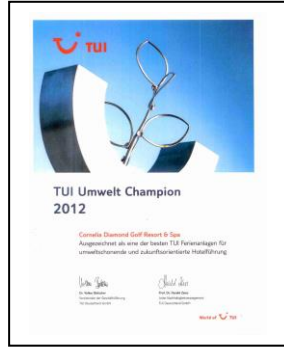
TUI – UMWELT CHAMPION