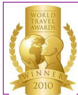
WTA – World's Leading All-Inclusive Golf Resort