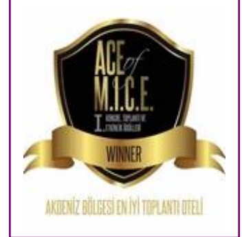
ACE of MICE – Best Congress Hotel in Antalya