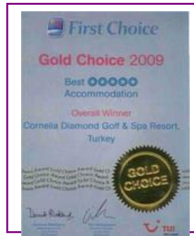
FIRST CHOICE – GOLD CHOICE