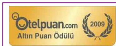
OTEL PUAN - GOLD