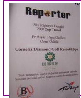
REPORTER MAG. – BEST SPA HOTEL