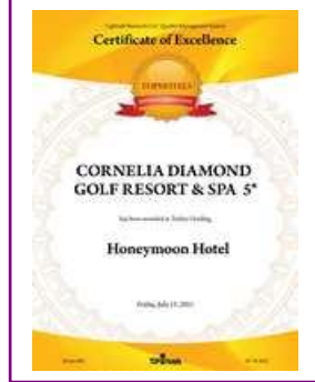
TOPHOTELS – Turkey's Leading Honeymoon