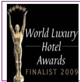
WORLD LUXURY – LUXURY GOLF RESORT