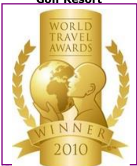
WTA – Europe's Leading Luxury Resort