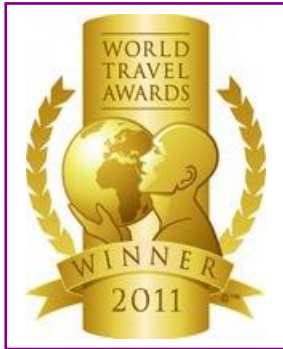
WTA - Europe's Leading Luxury Resort