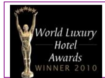
WORLD LUXURY – BEST LUXURY GOLF RESORT