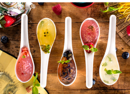
В ресторанах Madinat Jumeirah удовлетворят вкус даже самых взыскательных гурманов