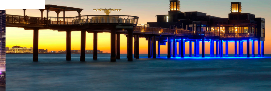
Благодарим за поездку туроператора Join UP!