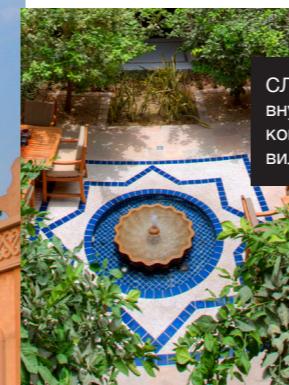
СЛЕВА НАПРАВО: внутренний дворик виллы комплекса Madinat ; интерьер виллы; Бурдж-Халифа.

Соблазн не выходить за пределы Madinat Jumeirah достаточно велик, но в Дубае однозначно есть чем заняться. Оказаться там и не побывать в самом высоком сооружении в мире – Бурдж-Халифа – просто невозможно. На его