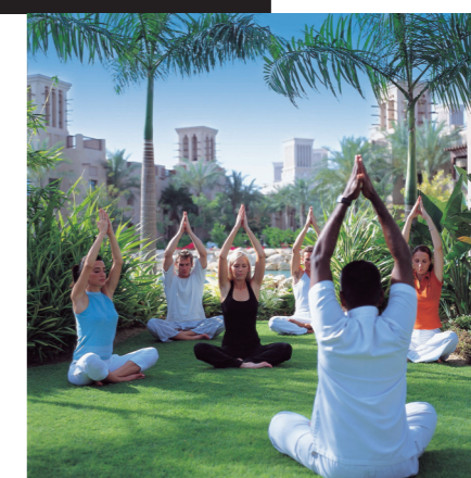
ПО ЧАСОВОЙ СТРЕЛКЕ: поющие фонтаны Дубая; занятия йогой в отеле; один из городских парков.

ДУБАЙ-МОЛЛ – ЭТО 1200 БУТИКОВ СО ВСЕГО МИРА И СТО МИЛЛИОНОВ ПОКУПАТЕЛЕЙ.